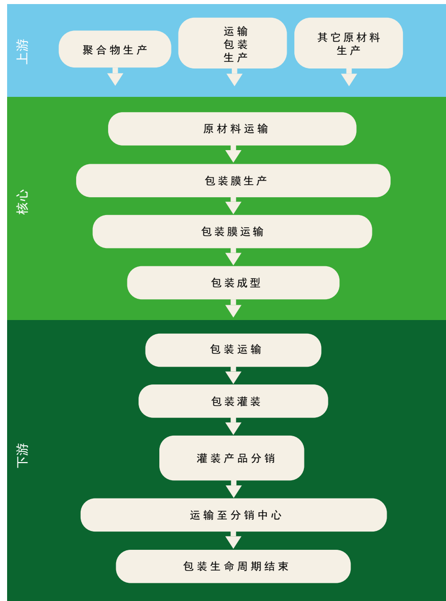
所述LCA流程范围和阶段的信息图表。

典生产工厂采购可再生水电，并通过原产地保证为赫尔辛堡工厂的生产加热流程采购可再生沼气。自2020年起，爱克林还通过购买国际可再生能源证书（I-REC）为中国的生产工厂购买了可再生能源。电力生产使用了Sphera LCA专业版2023.1软件提供的数据库数据（瑞典电力为水力发电：14.2克CO 2 当量/千瓦时，以及中国电力，假设等于日本风力发电：16.3克CO 2 当量/千瓦时）。化学品（油墨等）的使用量很小。所分析的所有市场的核心流程都是相同的。