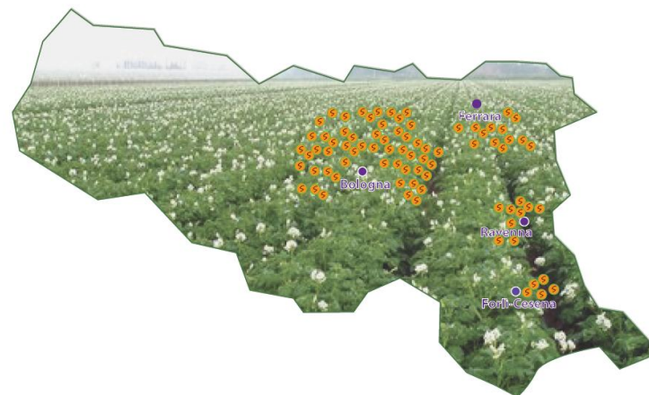
Fig. 2 - Ubicazione delle aziende coltivatrici di patate del Consorzio.

Per il Core module sono stati utilizzati dati specifici raccolti dai fornitori e soci del Consorzio Patata Italiana di Qualità. Per la fase agricola il campione è stato selezionato distinguendo tutte le aziende in base alle dimensioni e denominando "aziende piccole" quelle con una superficie < di 3 ha, "aziende medie" quelle con una superficie compresa fra 3 e 10 ha e "aziende grandi" quelle con una superficie > di 10 ha. Tutte le aziende sono ubicate nella Regione Emilia Romagna. È stato selezionato un numero di coltivatori di patate pari a 30 su circa 300 soggetti, dall'elaborazione e pesatura di tutti i dati raccolti, è stato possibile schematizzare tre tipologie di aziende denominate, appunto, "piccola", "media" e "grande". In tal modo la fase agricola risulterà rappresentativa di tutto il Consorzio poiché prende in considerazione la diversità legata alle dimensioni dei campi coltivati.