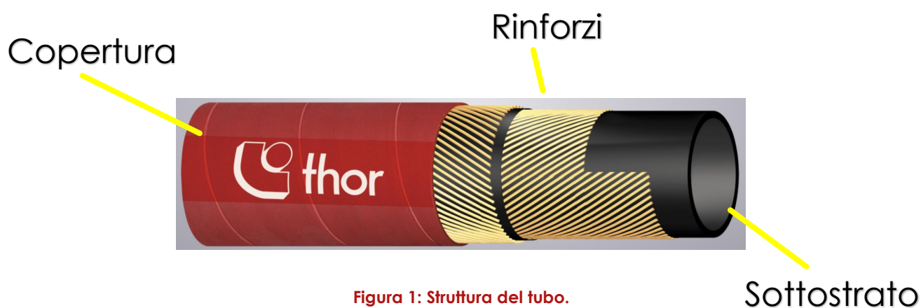
Figura 1: Struttura del tubo.

Alla base della progettazione di ogni tubo, vi sono considerazioni in merito alla sezione, alla tenuta di pressione e alle normative di riferimento (che normano in genere sia la sezione che la tenuta di pressione).