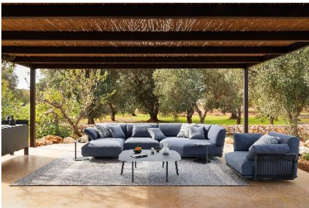
Figura 1- Immagine esemplificativa