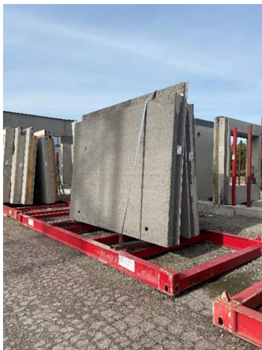
Figur 1 Sandwich Typ CP