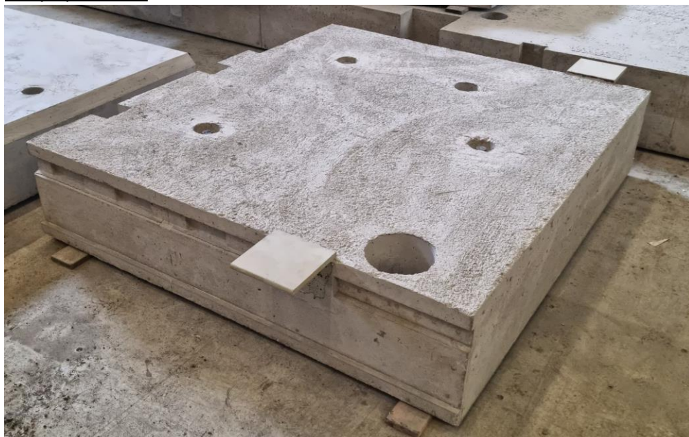
Figur 1 D-platta