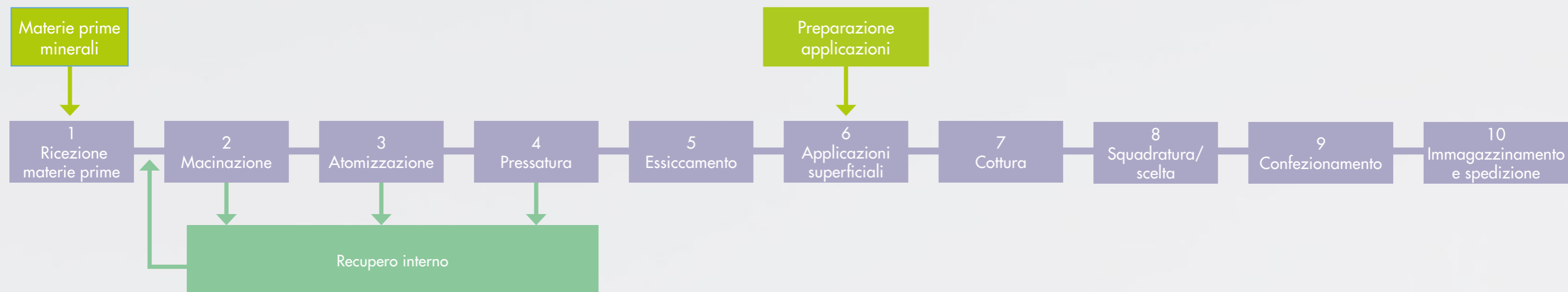
DIAGRAMMA FLUSSO DEL PROCESSO PRODUTTIVO