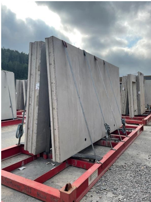
Figur 1 Massivvägg