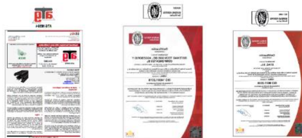
Figura1. Certificaciones ISO 9001, ISO 14001 y ATG de STAC DIVISIÓN DE PERFILES AISLANTES

Lugar de producción: Polígono industrial Picusa s/n. 15900 A Matanza, Padrón, A Coruña (España).