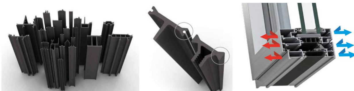
Figura 2. Perfiles de poliamida. Perfiles con y sin cordón termoadhesivo. Perfiles dentro de ventana.

Descripción del producto: El perfil de rotura de puente térmico está compuesto de PA66 reforzada con el 25% de fibra de vidrio. Estos perfiles se utilizan como un material aislante térmico, intercalado entre los perfiles de aluminio exterior e interior de puertas y ventanas, que hace de barrera para minimizar la transferencia energética entre el exterior y el interior.