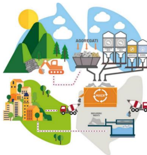
Figura 2. Schema del processo di produzione.