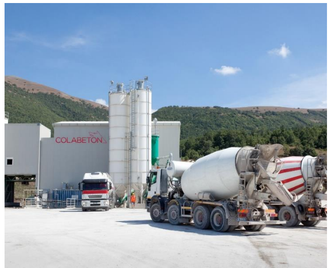
Figura 1. Colabeton S.p.a.

La sicurezza garantita dall'assoluta trasparenza dei controlli, la competenza del personale, oltre alle soluzioni tecnologiche d'avanguardia fanno di Colabeton uno dei leader più affidabili nella produzione di calcestruzzo in Italia ( https://www.colabeton.it/azienda/company-profile ).