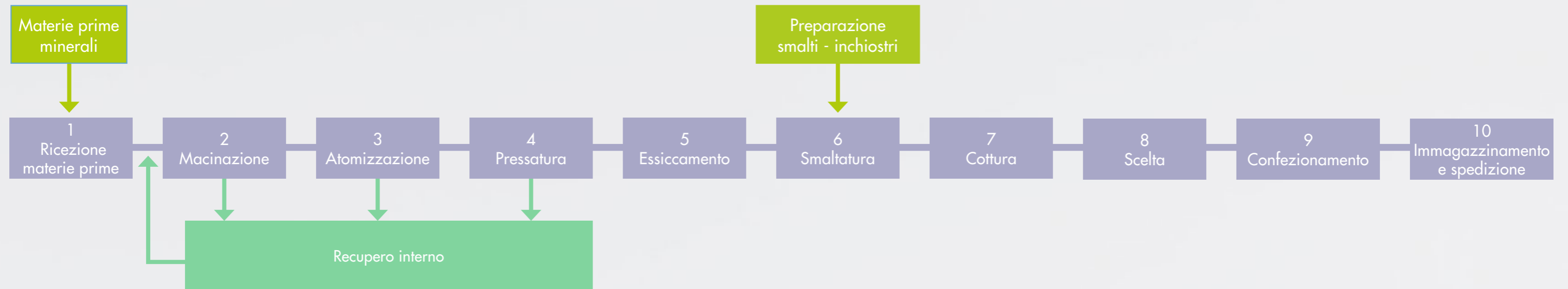
DIAGRAMMA FLUSSO DEL PROCESSO PRODUTTIVO