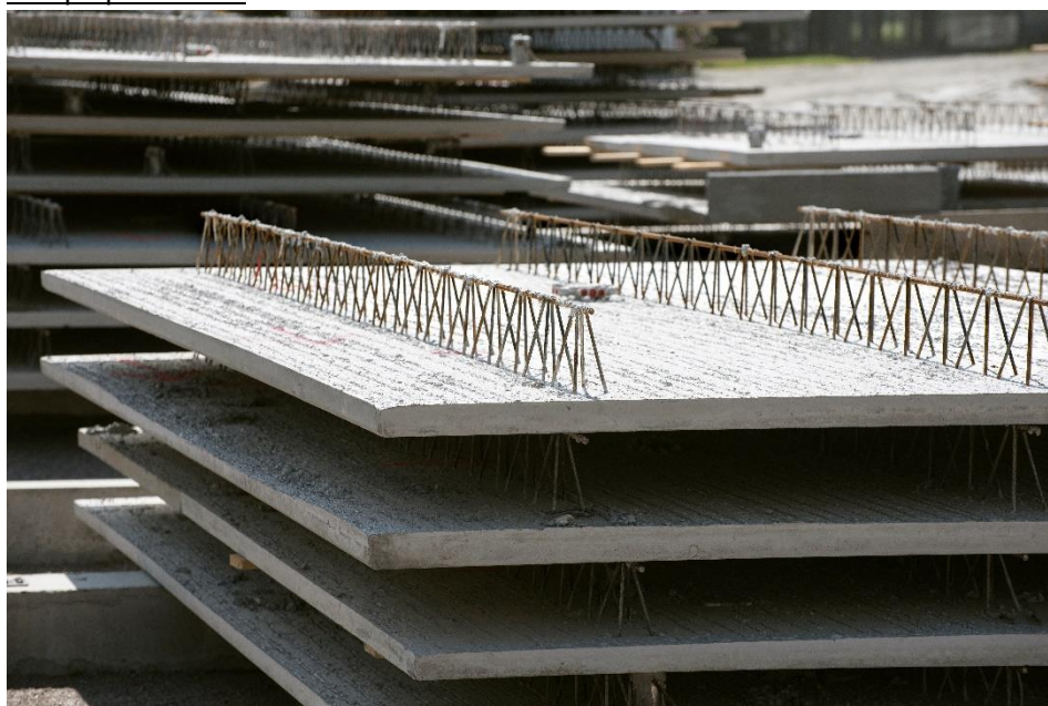
Figur 1 Plattbärlag