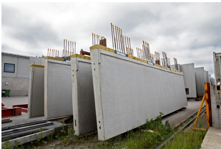
Figur 1 Balkongplatta